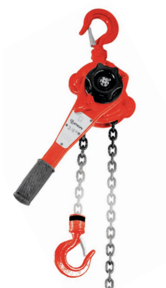
CATENA Mt. 3