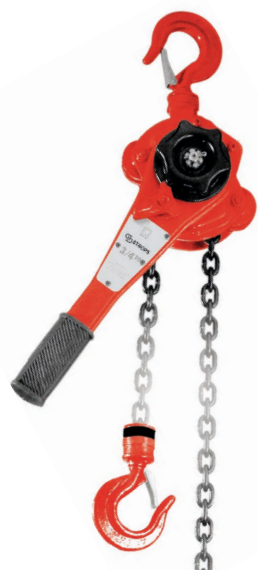
CATENA Mt. 1,5