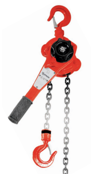
CATENA Mt. 1,5